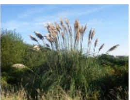
Herbe de la pampa