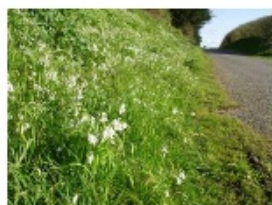
Ail à tige triquètre

C'est une espèce exotique généralement importée pour une valeur ornementale ou un intérêt économique qui, par sa prolifération, transforme ou dégrade des milieux naturels de manière plus ou moins irréversible