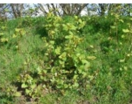
Renouée du Japon