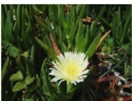
Griffe de sorcière