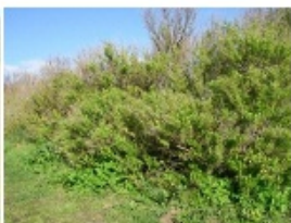
Sénéçon en arbre