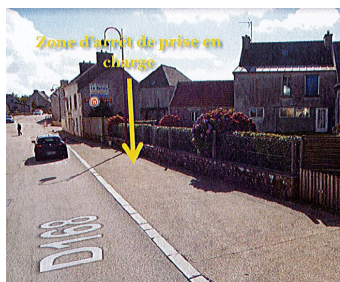
Zone d'arrêt de prise en charge

La création d'un arrêt de car au bourg a été autorisée par le Conseil Régional. Le matin, lors de la prise en charges des élèves, le car venant de Plourin par la route départementale 68 stationnera sur chaussée "route de Ploudalmézeau" au niveau de l'abribus mis en place par la commune.