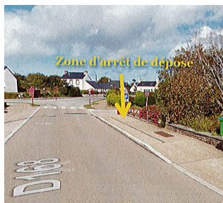
Zone d'arrêt de dépose